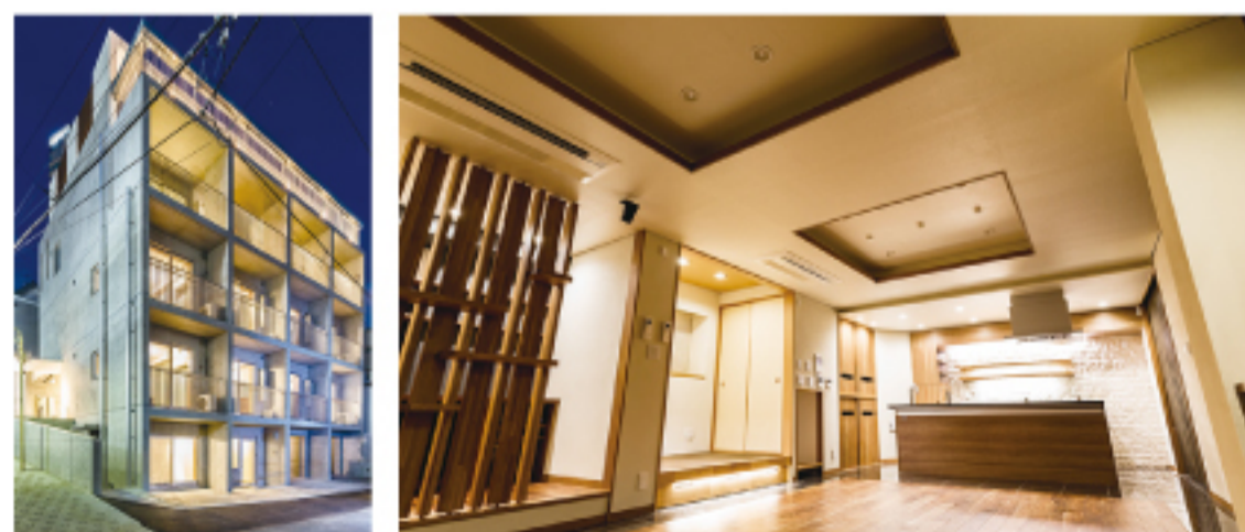
(仮称)代々木RH新築工事