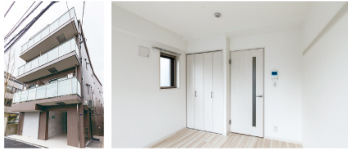
(仮称)渋谷区本町二丁目計画新築工事