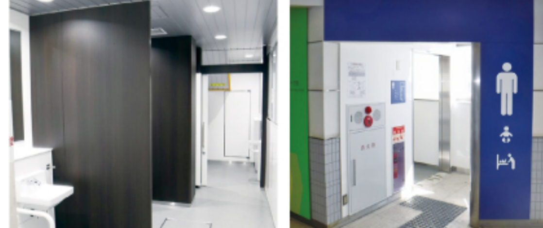
多摩M旅客トイレ更新工事