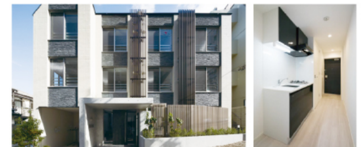
(仮称)高円寺南1丁目PJ新築工事