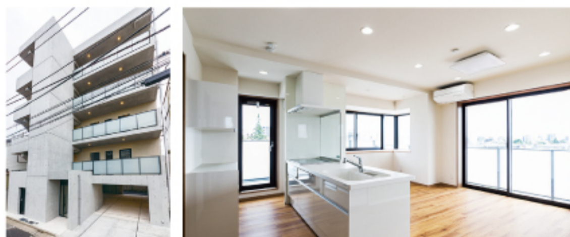
(仮称)中野3丁目計画新築工事